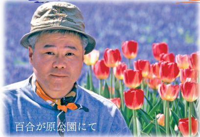
百合が原公園にて