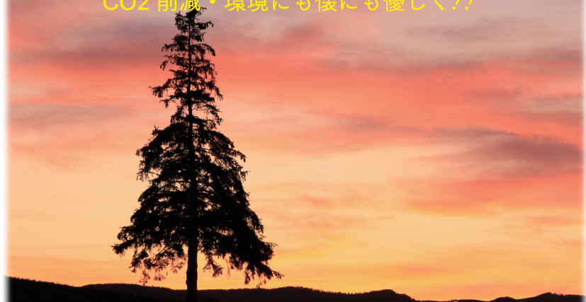
美瑛・クリスマスツリーの木